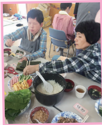
手巻き寿司の具材は どれにしようかな～?