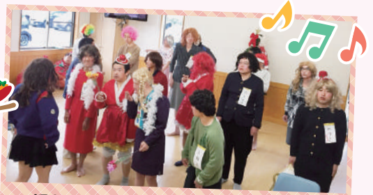
男性メンバーでダンシングヒーローを踊りました。女装に気が入っています。