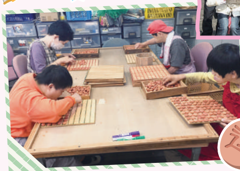
運玉をマスに並べて 仕分けをします。