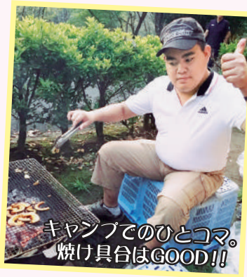
キャンプでのひとコマ。 焼け具合はGOOD!!