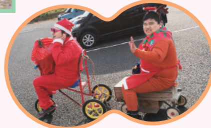
サンタさんと トナカイさん!! 乗る位置が 逆っ!!