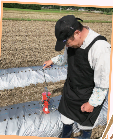
ゴボウの種まきの様子。