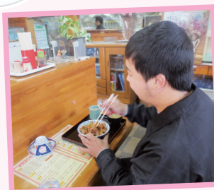
週末の外食も 楽しみの一つです!!