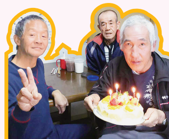
クリスマスで 手作りケーキを いただきます♡