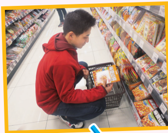
買い物や調理 むずかしいけど 頑張ってます!!