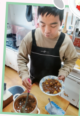
おいしいカレーができました!!