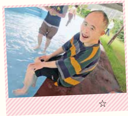
日南市のコテージに行きました。